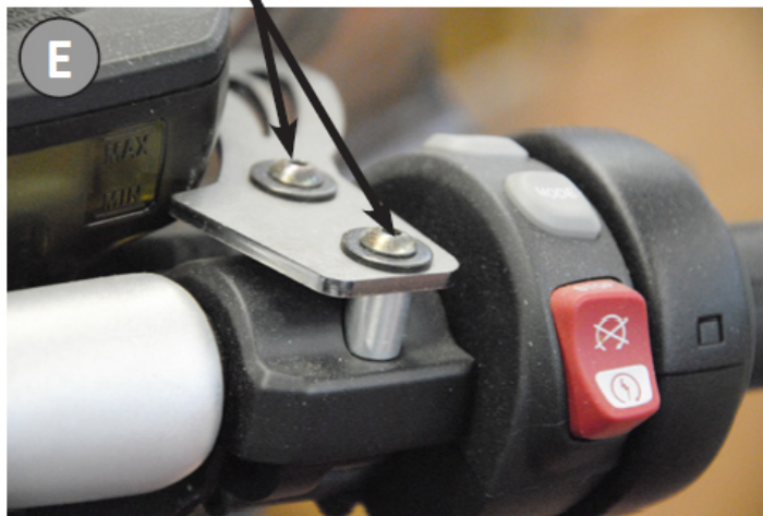
Viti TB + rondella piana Inbusschrauben + flache Unterlegscheibe Allen screws + flat washers

Distanziali H13 D 10 Hülsen H13 D10 Spacers H13 D10