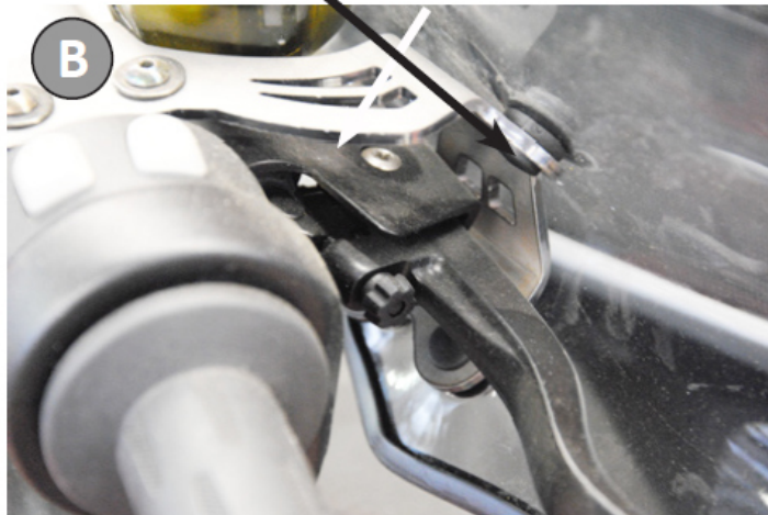
Dado esagonale, Sechskant Mutter Hexagon nut